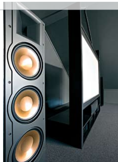
Lerretskonstruksjonen sett fra siden.