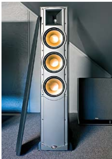
Kongen av dynamikk. Klipsch RF83.

– Jo, altså, vi bygget på huset for noen år siden. Det var da seksjonen vi nå står i ble oppført. Selv om det kanskje ikke var planen, ble en del av løsningene vi valgte den gang nyttige for formålet vi nå benytter rommet til. Blant annet er gulvet under oss hele 60cm tykt, og hulrommet er fylt med Rockwool. I tillegg ligger det ferdig opplegg