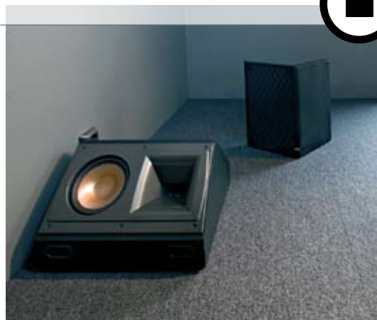
En liggende bakhøyttaler. Det ser kanskje merkelig ut, men du verden som det fungerer.