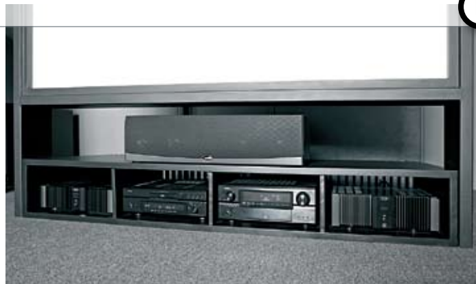
Racket er integrert i konstruksjonen som holder lerretet. Tom bruker sorte komponenter for symmetriens skyld